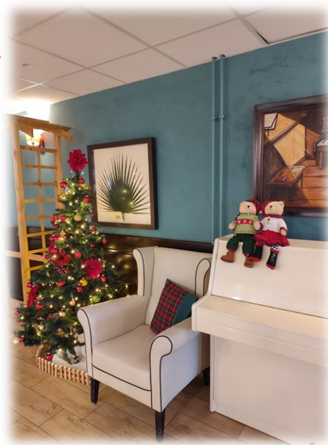
Rez de chaussée